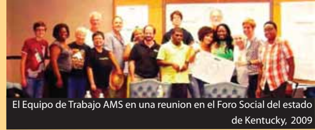
El Equipo de Trabajo AMS en una reunion en el Foro Social del estado de Kentucky, 2009