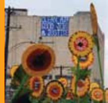
Acción contra incinerador (resultado de 2 Asambleas de Movimientos Sociales). FSEU. Detroit, Junio 2010

La organización entre sectores es intensificada. Las alianzas políticas y las relaciones organizacionales están formadas. Las acciones nacionales son puestas en marcha.