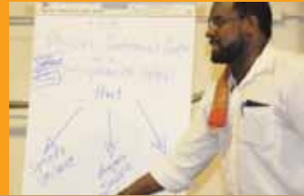
Asamblea del Movimiento Popular de Atlanta del Sur. Junio de 2010

Se articulan nuevas percepciones que expandan la amplitud de nuestro entendimiento y conexiones.