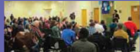
Asamblea de Movimientos Sociales de la ciudad de Detroit, abril 2011