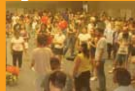
Asamblea de Movimientos Populares por la Justicia Ecológica. FSEU.Detroit, Junio, 2010

Las direcciones estratégicas son identificadas, establecidas, clarificadas, y/o afirmadas.