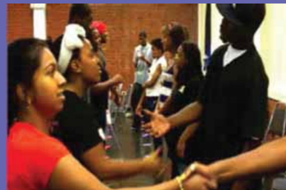
Asamblea por la Justicia en la Educación de los Jóvenes de Atlanta. Atlanta, Julio 2011