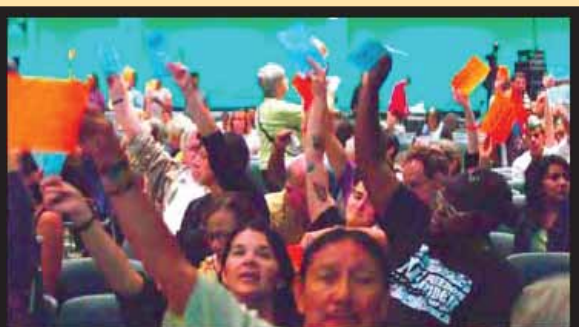
Asamblea Nacional de Movimientos Sociales apoyando esta declaración en el Foro Social EU en Detroit, junio 2010.