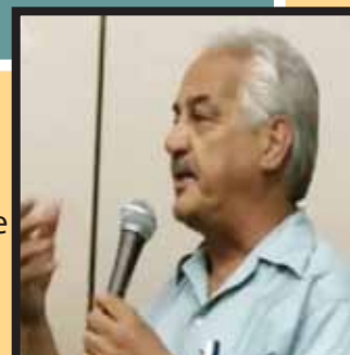
Reconstruyendo un movimiento de solidaridad con la Asamblea de la Lucha Anticolonial de Puerto Rico, FSEU, Junio 2010.